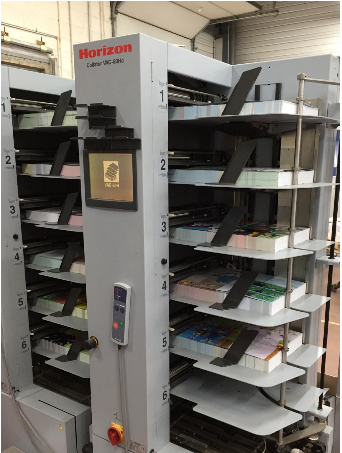
Voici la dernière étape de la fabrication du livre.