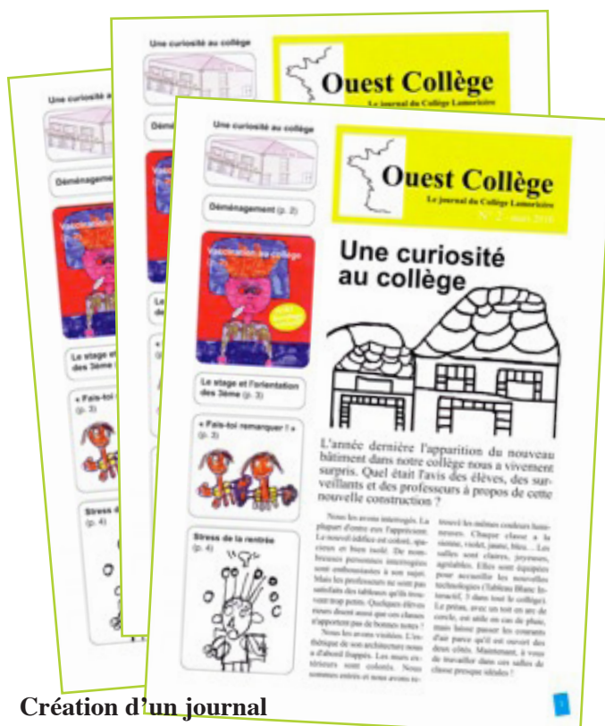
Création d'un journal lors de l'action culturelle à St Philbert de Grandlieu